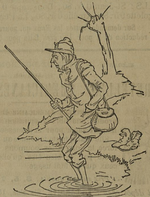
S'il n'a pas son étui de Pastilles Géraudel, un pêcheur ne peut rien prendre, car il s'enrhume, étourdit, et fait fuir le poisson.

Dépôt à Cahors, pharmacies VINEL, FILHOL.