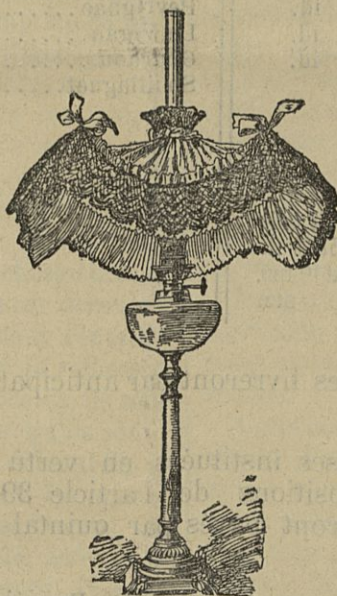
Lampe en bronze doré ciselé, et colonne onyx, complète, avec l'abat-jour en soie, offerte en prime à nos souscripteurs. Hauteur : 60 cent.

MM. E. GIRARD & A. BOITTE 42, Rue de l'Echiquier, Paris